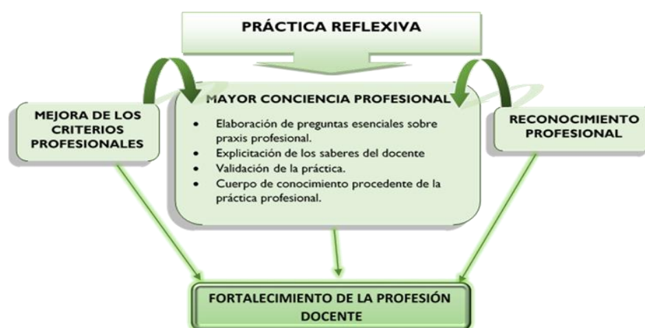
Figura 2. Impacto del Pensadero de maestros a través de la práctica reflexiva en el desempeño profesional docente.

Otro de los retos del proyecto supone pasar de ser una actividad basada en la voluntariedad de los docentes a ser una actividad de legitimidad profesional, es decir, asumir la validación de prácticas entre iguales como un aspecto esencial de la buena praxis profesional.